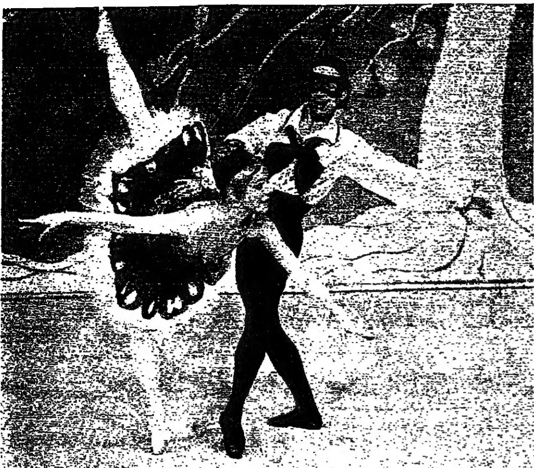
البرامج الجديدة التي يقدمها ويقدمها تلفزيون لـ ب.ب.مس. البريطاني، زاهدًا جملاً وجاذبية ظهور ثنائي الجاذبية باليوت وزوجته فانيلا اذ رقصا لأول مرة في «غالا» البريطاني. وعلى مساندر الطقطة هذه الصورة وهما على مسرح «ساندس» ومجزو سوبرانو وأن هوزيل وينشتر زوكمان.